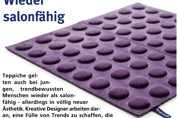
Teppiche gelten auch bei jungen, trendbewussten Menschen wieder als salonfähig - allerdings in völlig neuer Ästhetik. Kreative Designer arbeiten daran, eine Fülle von Trends zu schaffen, die kaum unterschiedlicher sein könnten. Farblich sind vor allem Blau- und Violett-Töne angesagt.