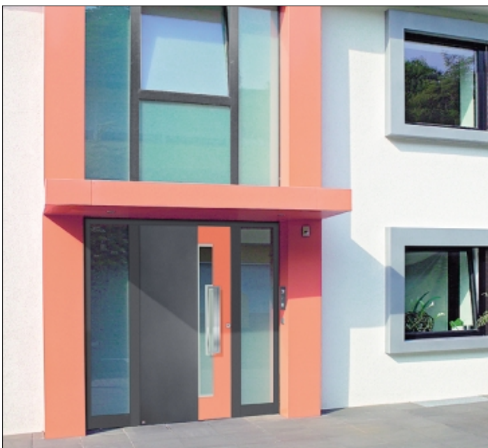
Haustüren aus Aluminium-Holz sind attraktiv, pflegeleicht und dazu noch energiesparend.