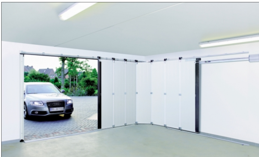
Platzsparend: Fehlt es an entsprechender Höhe, bieten auch seitliche Garagentore Sicherheit vor Diebstahl und Wetter.

Auch optisch zeigen die Tore neue Aussichten, da sie vertikal gegliedert sind. Neben den optischen und praktischen Gründen können auch bauliche den Ausschlag für ein Seiten-Sectionaltor geben: Wenn zum Beispiel unter der Decke kein Platz ist, um das Tor hierher zu öffnen oder es sich wegen einer Dachschräge nicht befestigen lässt. Wichtig: Einbauwillige sollten auch hierbei auf dieselben Qualitätsmerkmale von Markenherstellern setzen: Durch dicke und ausge-